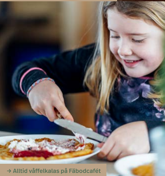
→ Alltid våffelkalas på Fäbodcaféet