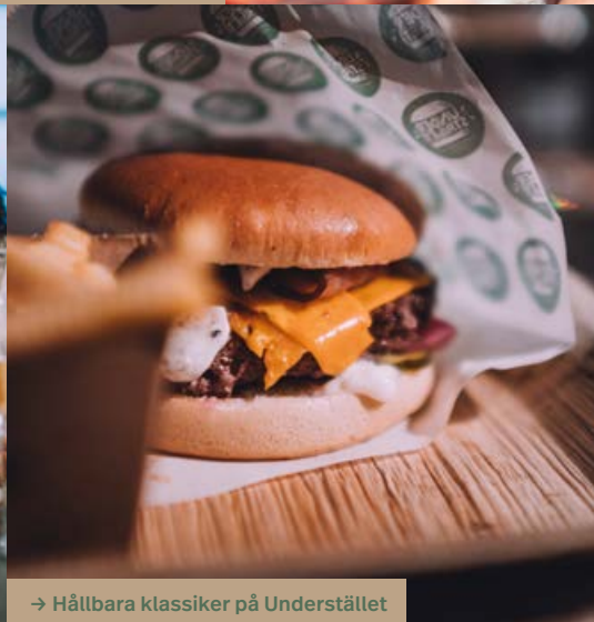
→ Hållbara klassiker på Understället