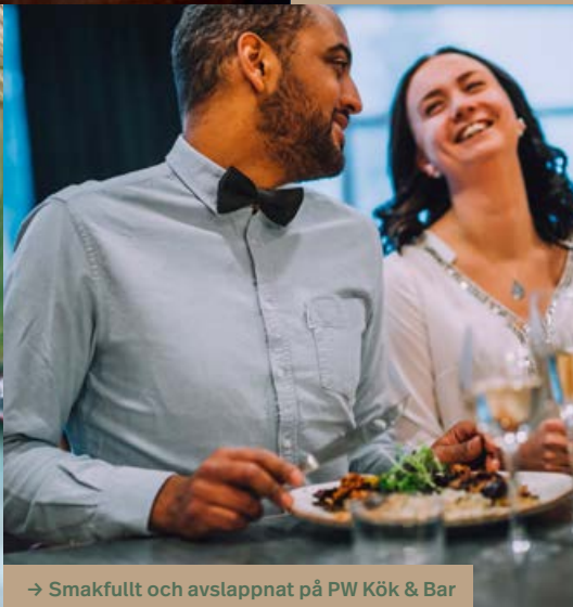
→ Smakfullt och avslappnat på PW Kök & Bar