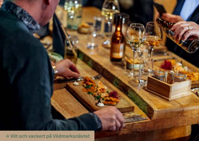
→ Vilt och vackert på Vildmarksnästet