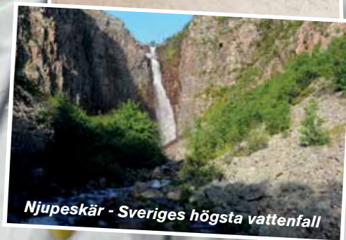
Njupeskar - Sveriges högsta vattenfall

NYHETER! MELLANHÖJDSBANA, QUICKJUMP OCH BJÖRNKVÄLL UTOMHUSBADET ÖPPET FRÅN 24 MAJ TESTA VÅR HÄFTIGA SKILLS AREA